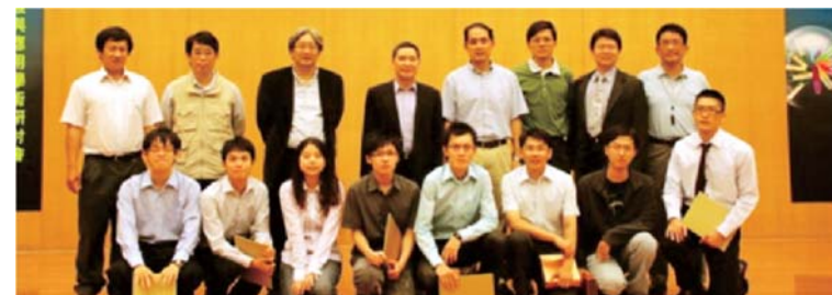
生命科學院年度學生論文壁報口頭競賽得獎同學與校外評審合照

在教研空間資源方面, 本人上任後, 發現相對於其他學院, 本學院空間過於狹小, 因此將「為學院爭取更大空間」列為最重要的工作之一。所幸, 學校新建國際學術研究大樓已近完工, 故有調整空間機會, 本學院終致爭取到約315坪空間, 相信本院老師於研究上與學生於教育上, 可獲得適當空間的舒緩, 希望在本學院全體師生共同努力下, 高醫生命科學院在各方面的表現一定可以百尺竿頭, 更進一步!